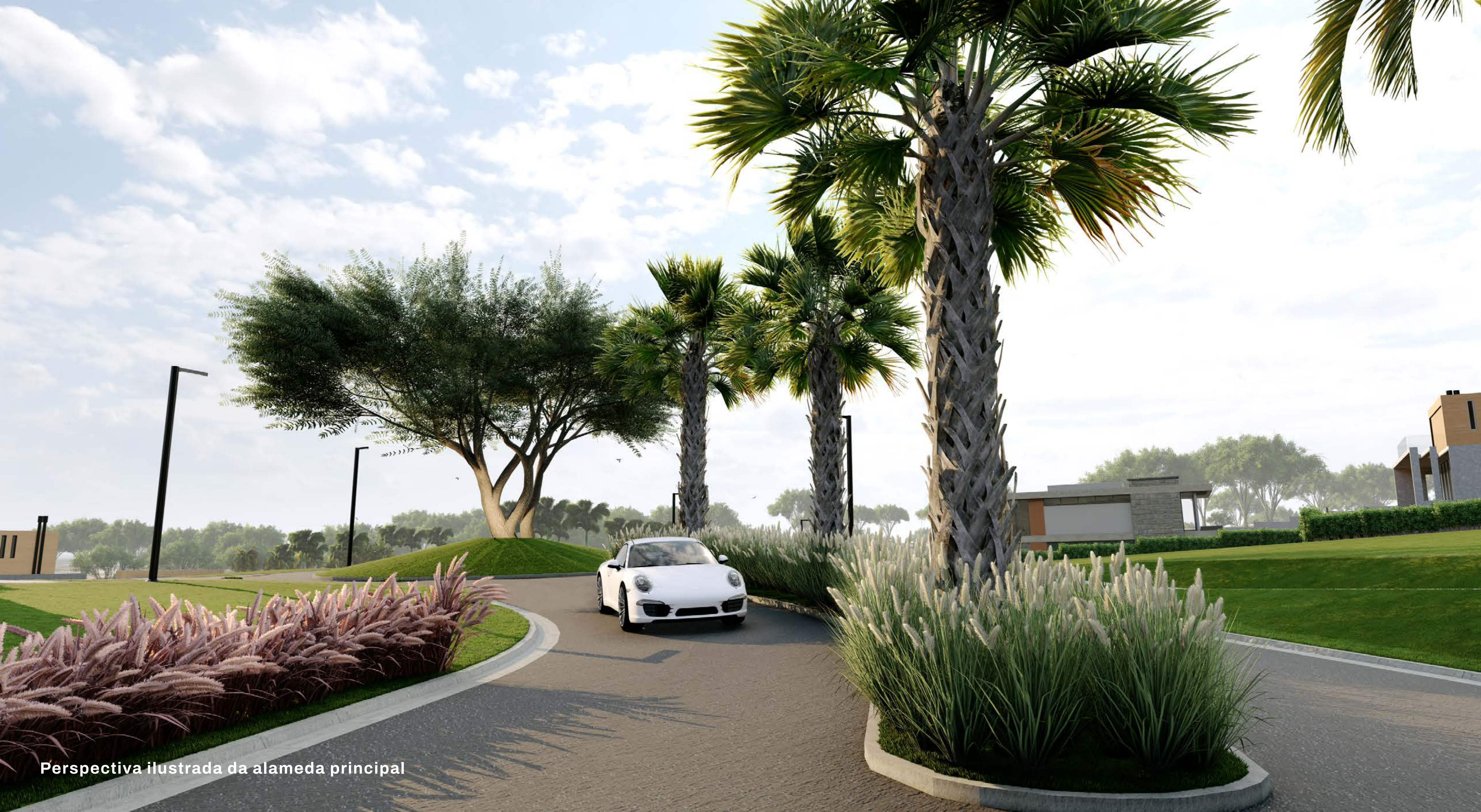
Perspectiva ilustrada da alameda principal