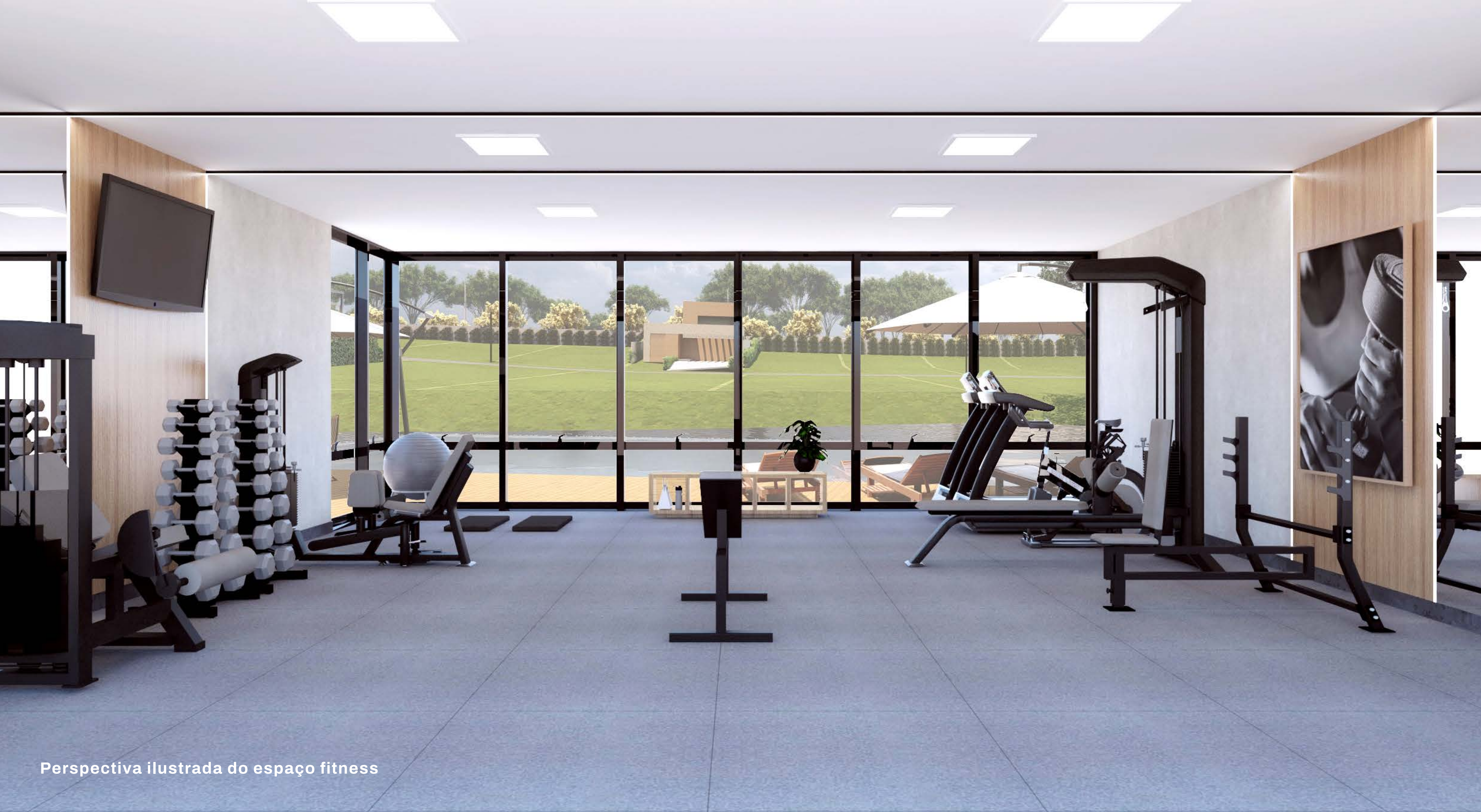
Perspectiva ilustrada do espaço fitness