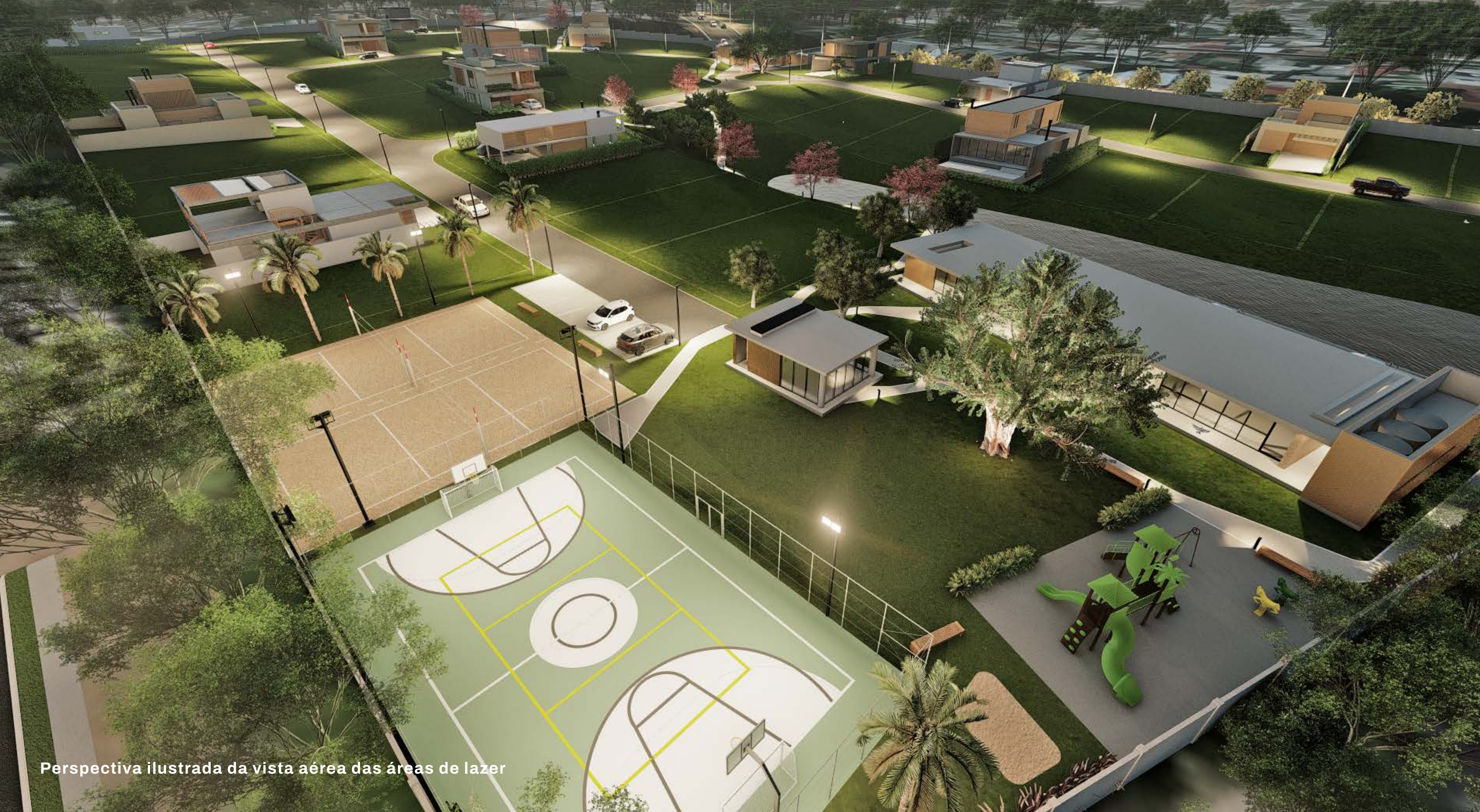
Perspectiva ilustrada da vista aérea das áreas de lazer