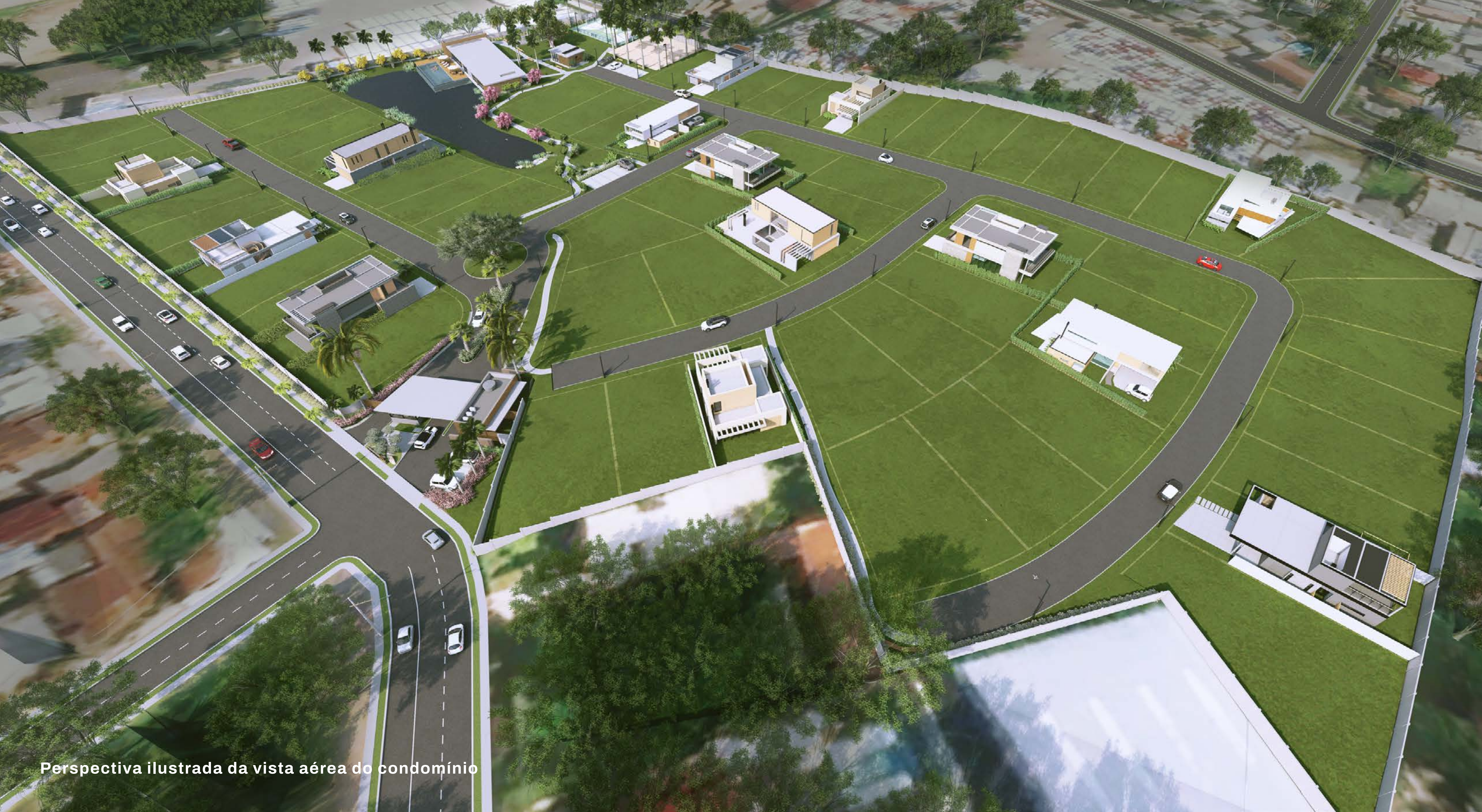
Perspectiva ilustrada da vista aérea do condomínio