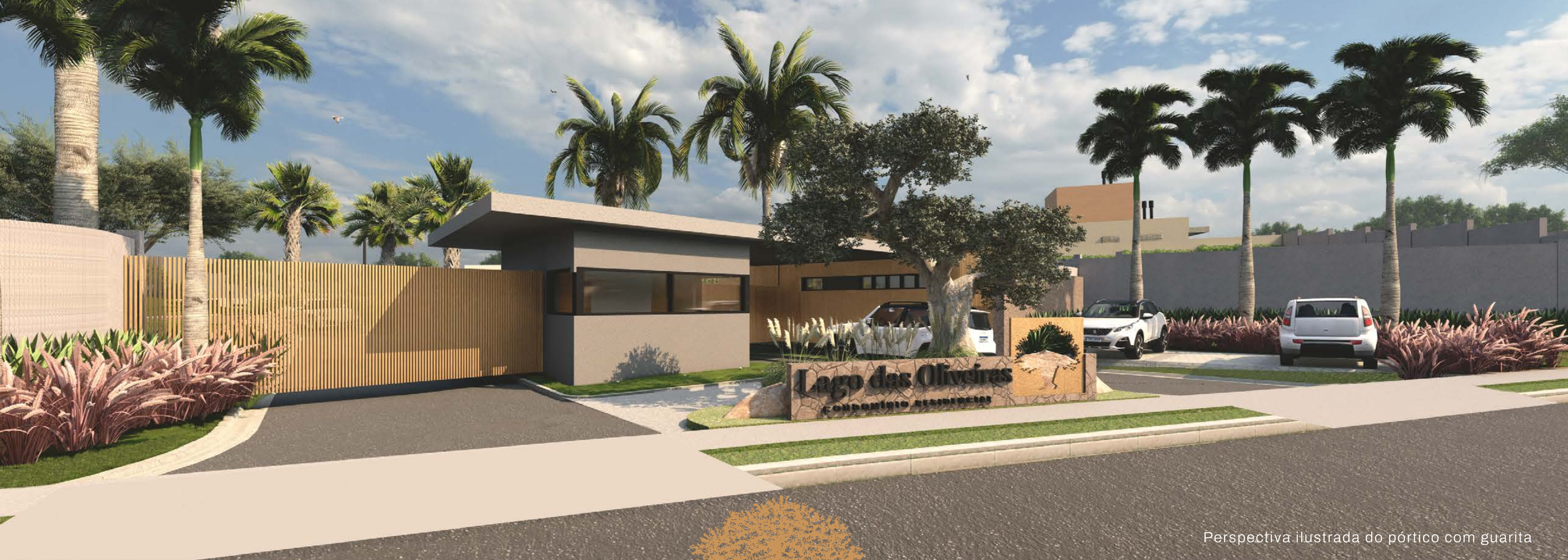
Perspectiva ilustrada do pórtico com guarita