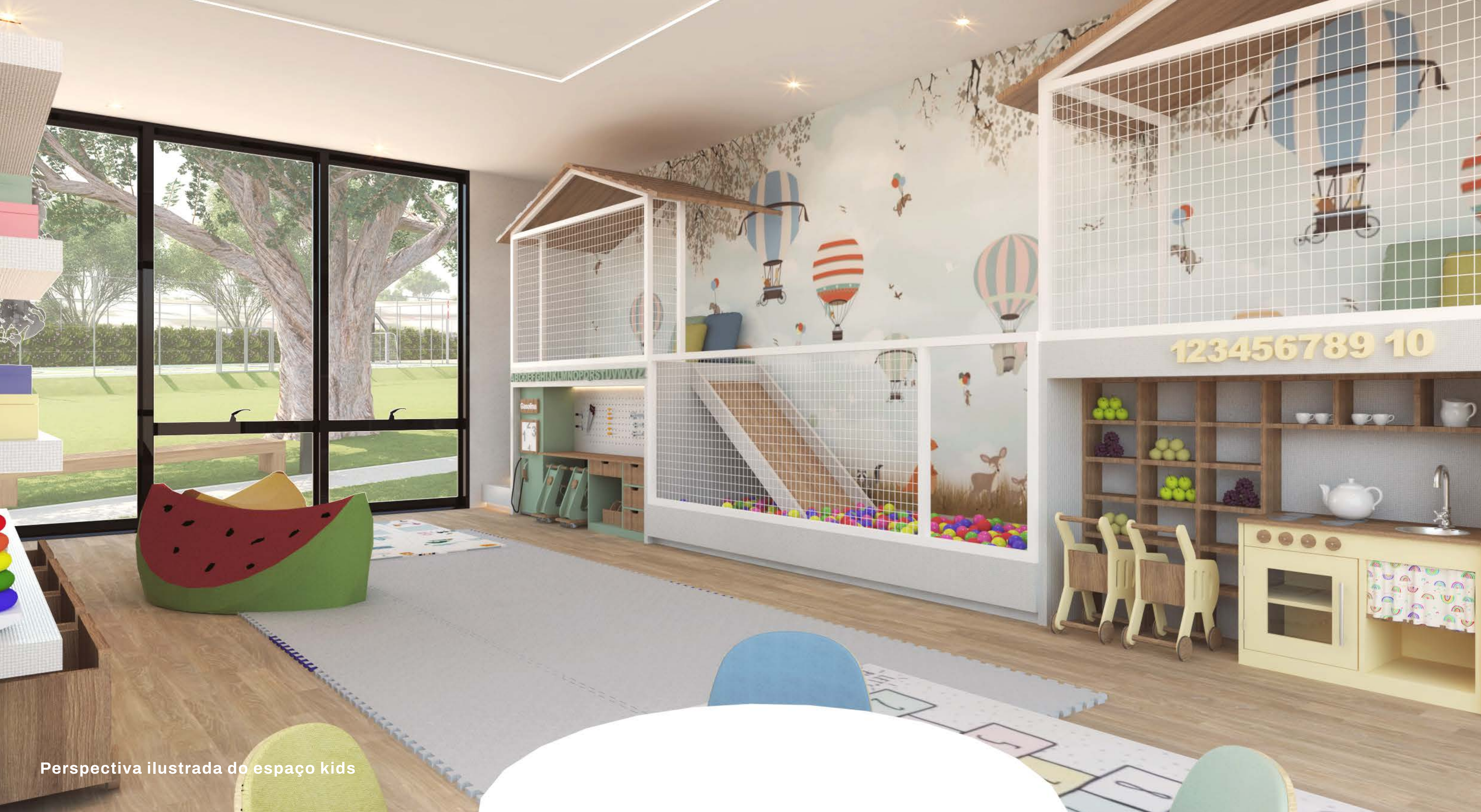
Perspectiva ilustrada do espaço kids