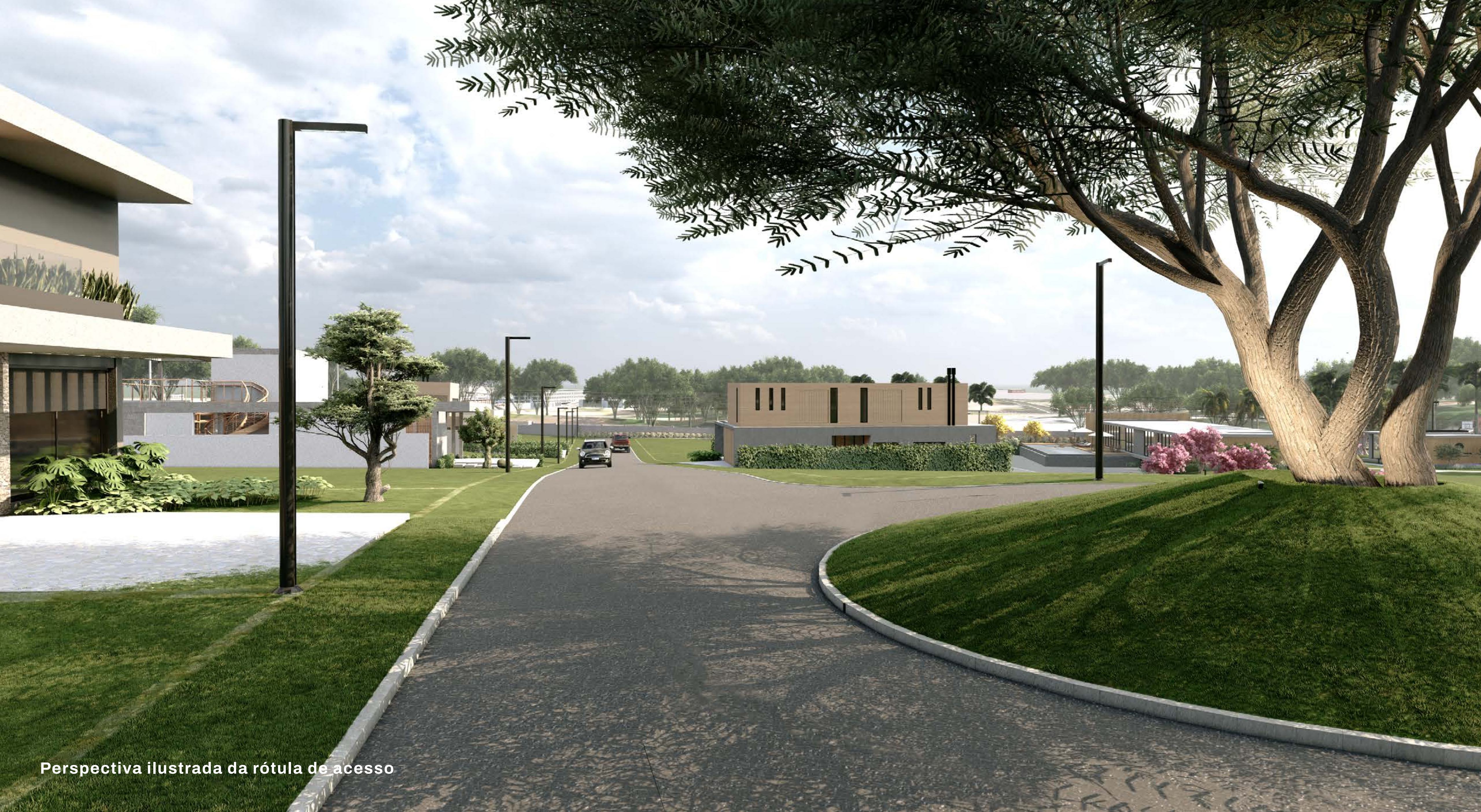
Perspectiva ilustrada da rótula de acesso