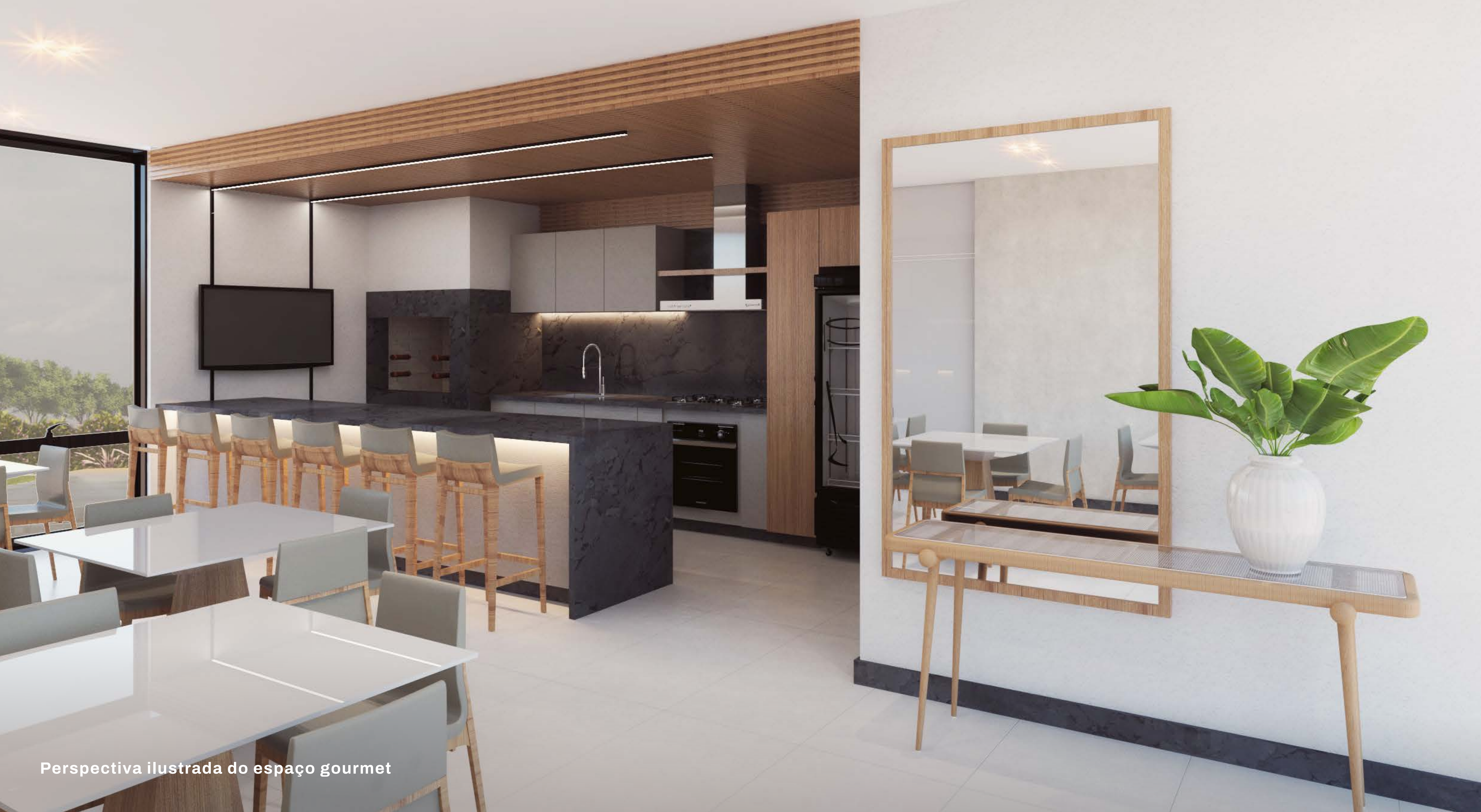
Perspectiva ilustrada do espaço gourmet