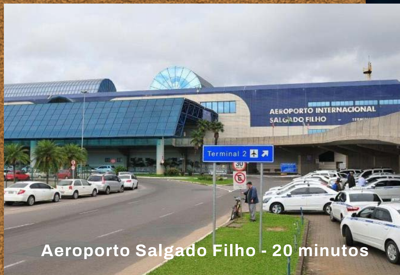
Aeroporto Salgado Filho - 20 minutos