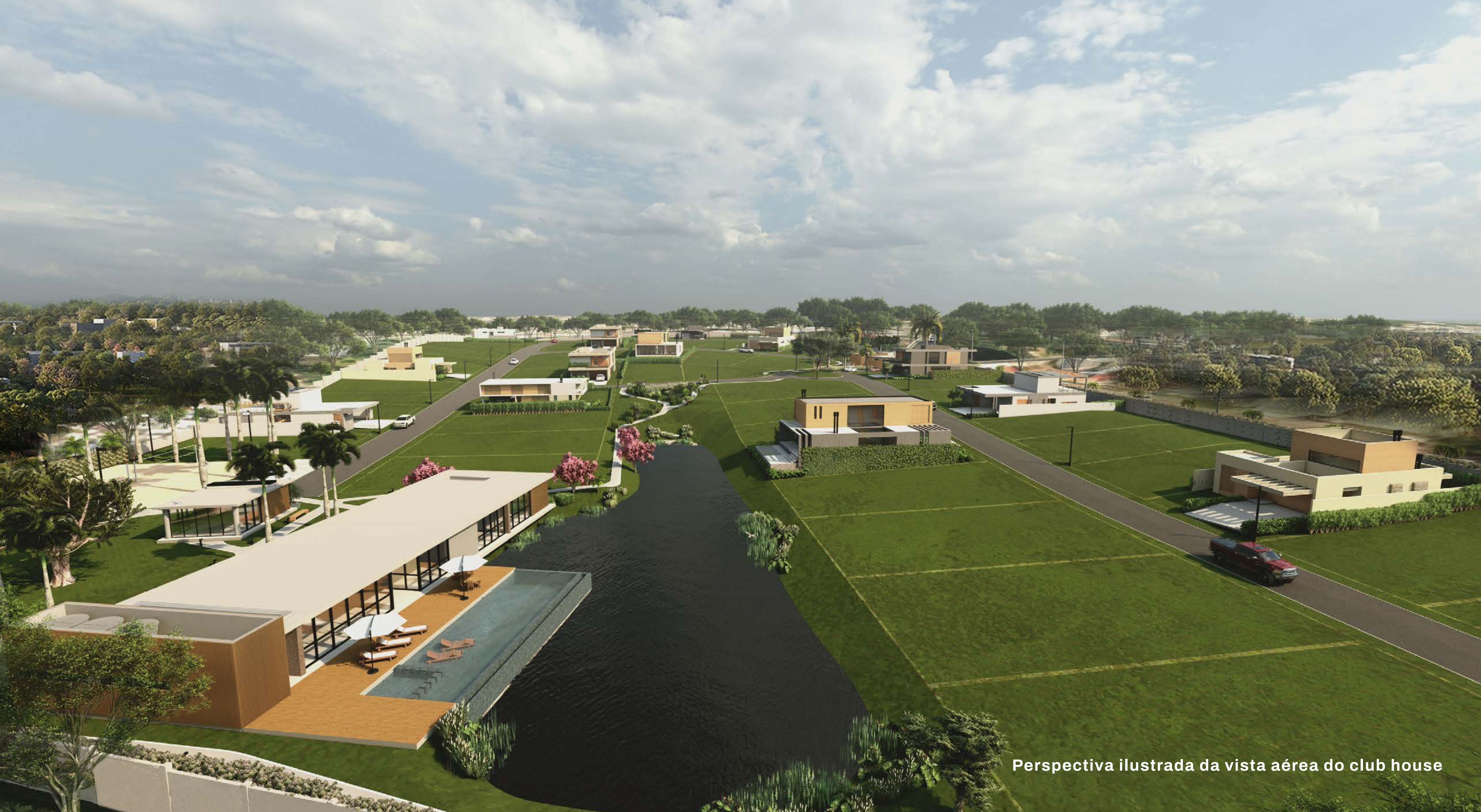
Perspectiva ilustrada da vista aérea do club house