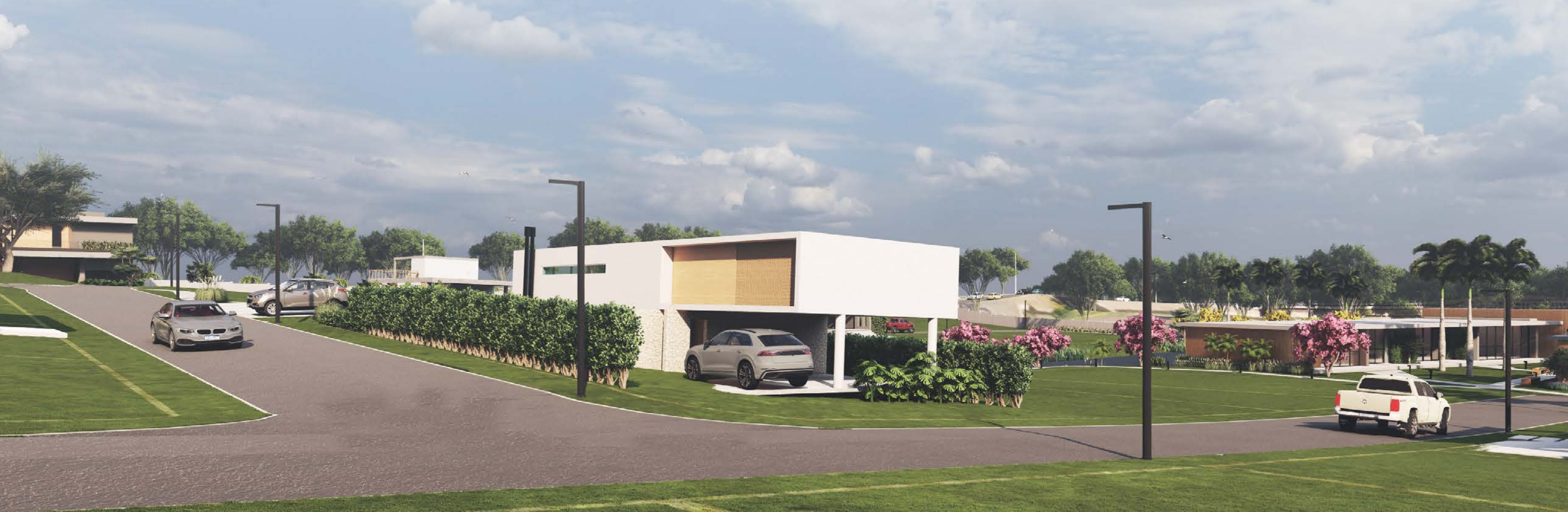
Perspectiva ilustrada da vista da rua