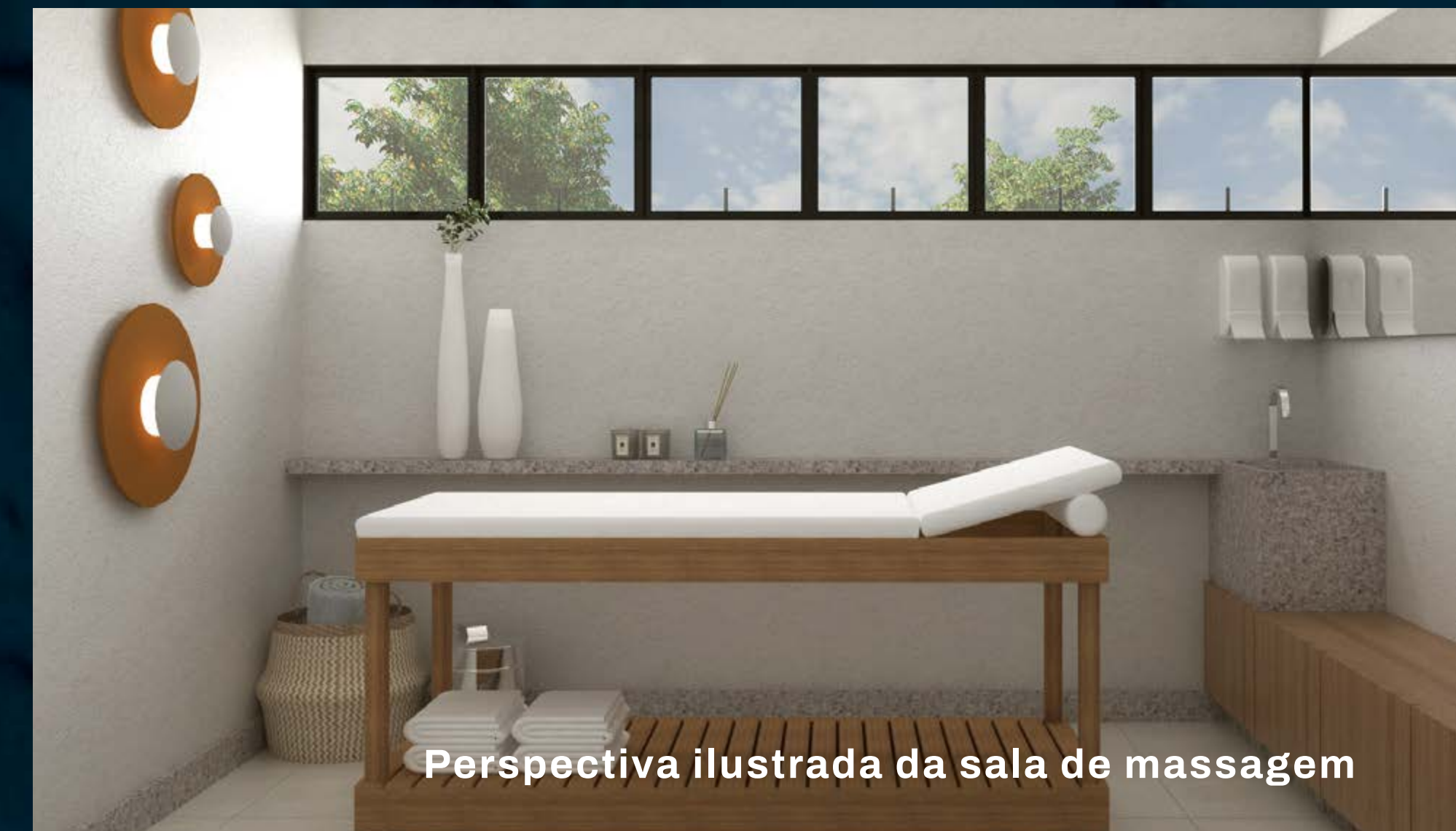
Perspectiva ilustrada da sala de massagem