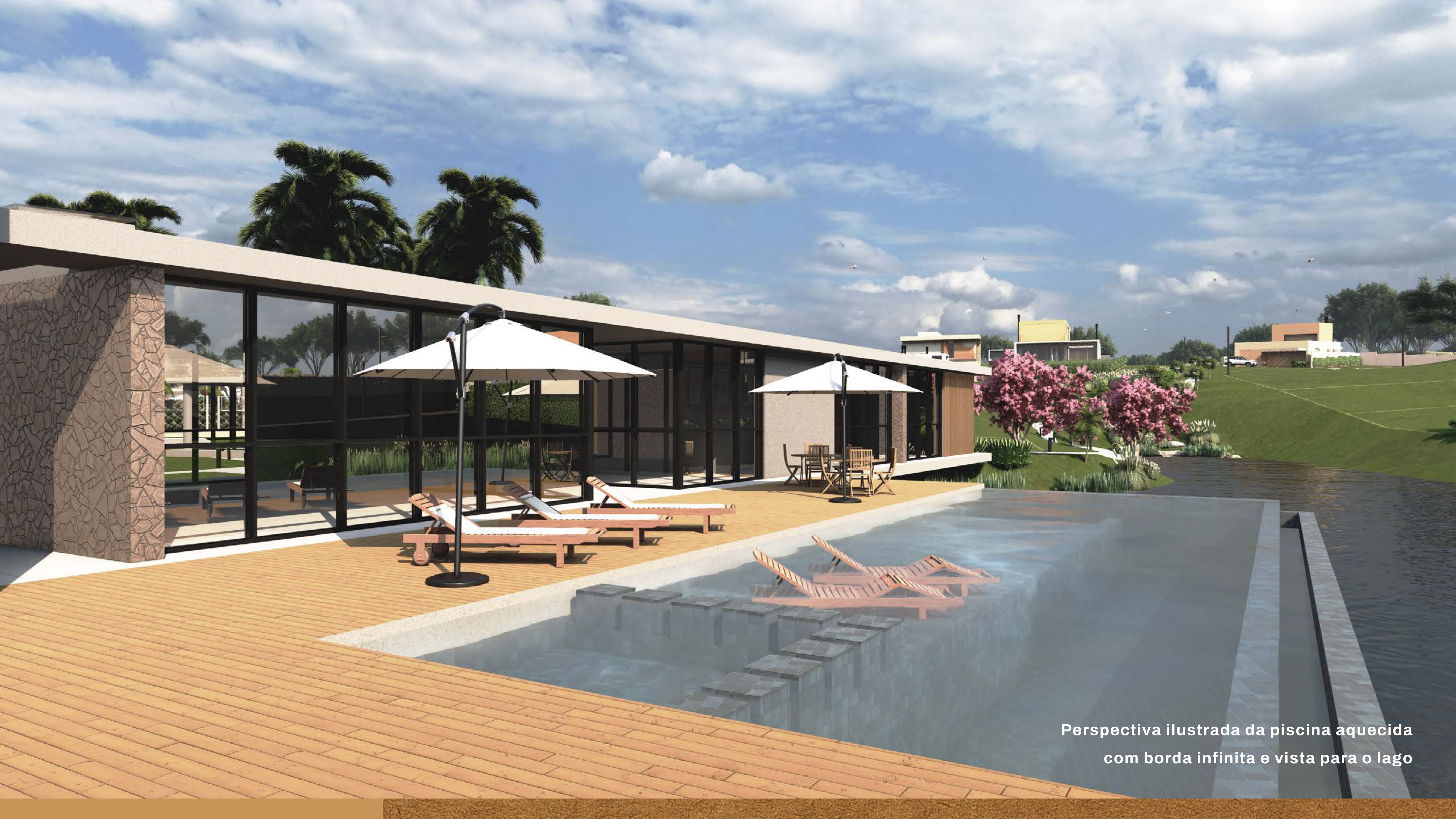
Perspectiva ilustrada da piscina aquecida com borda infinita e vista para o lago