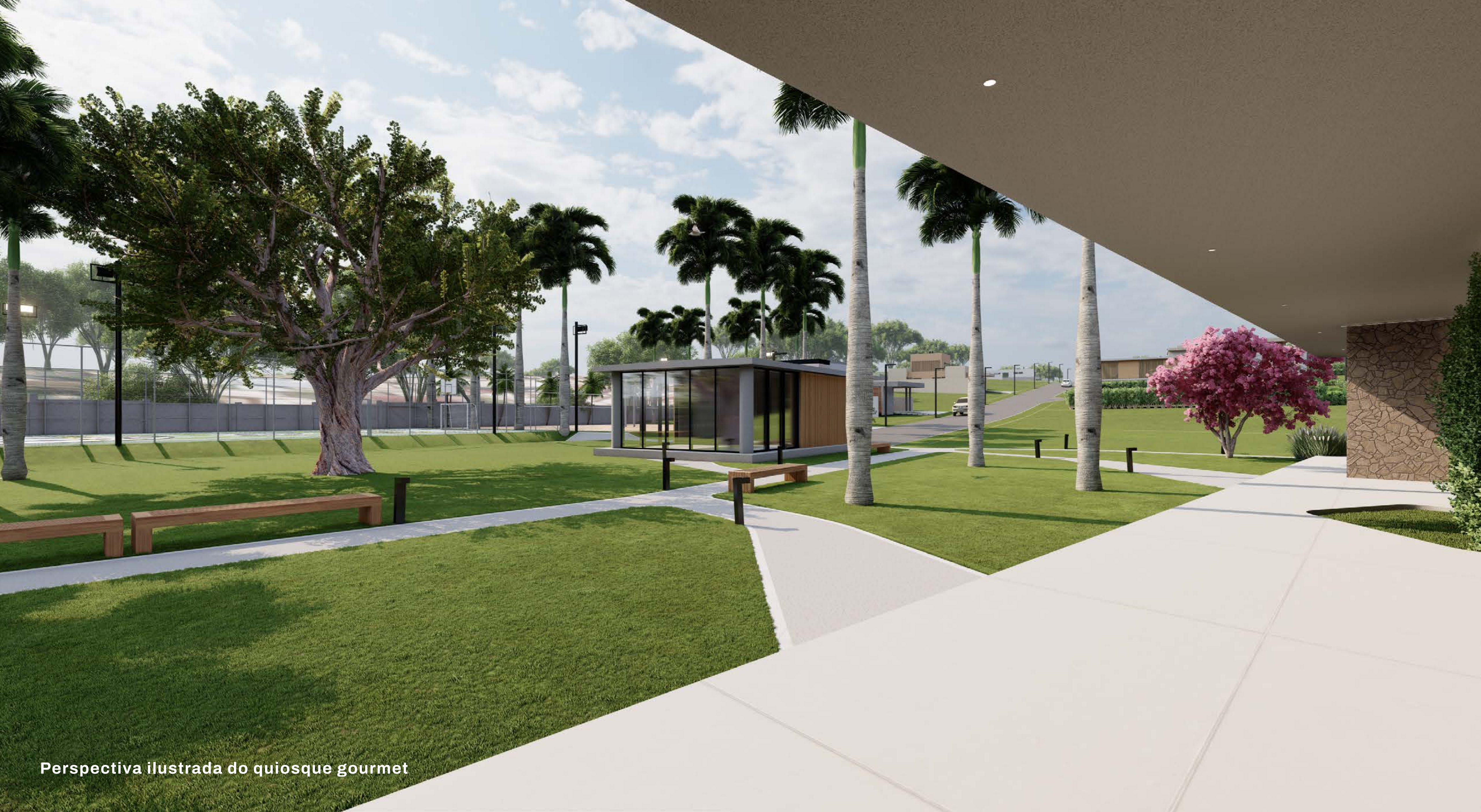
Perspectiva ilustrada do quiosque gourmet