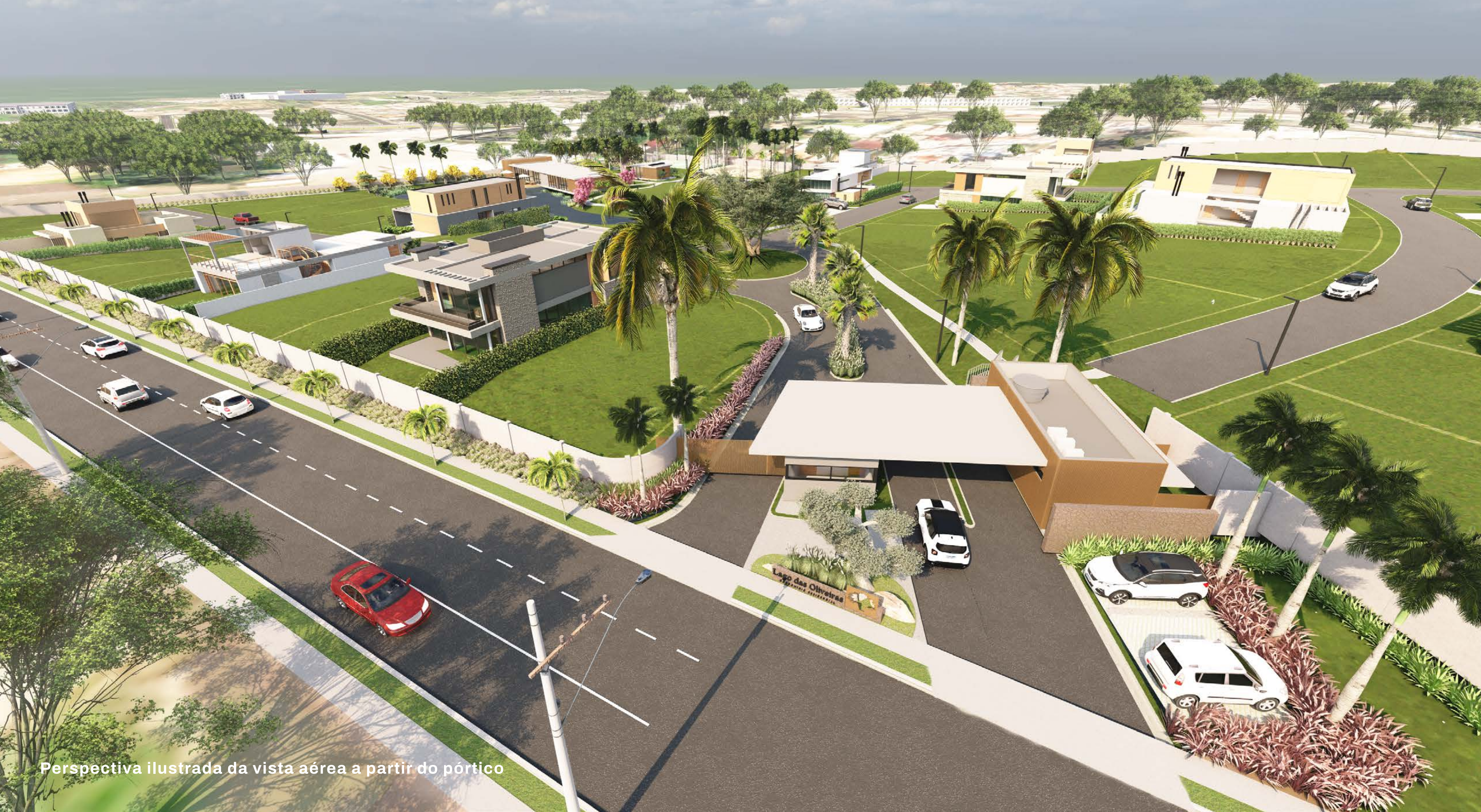
Perspectiva ilustrada da vista aérea a partir do pórtico