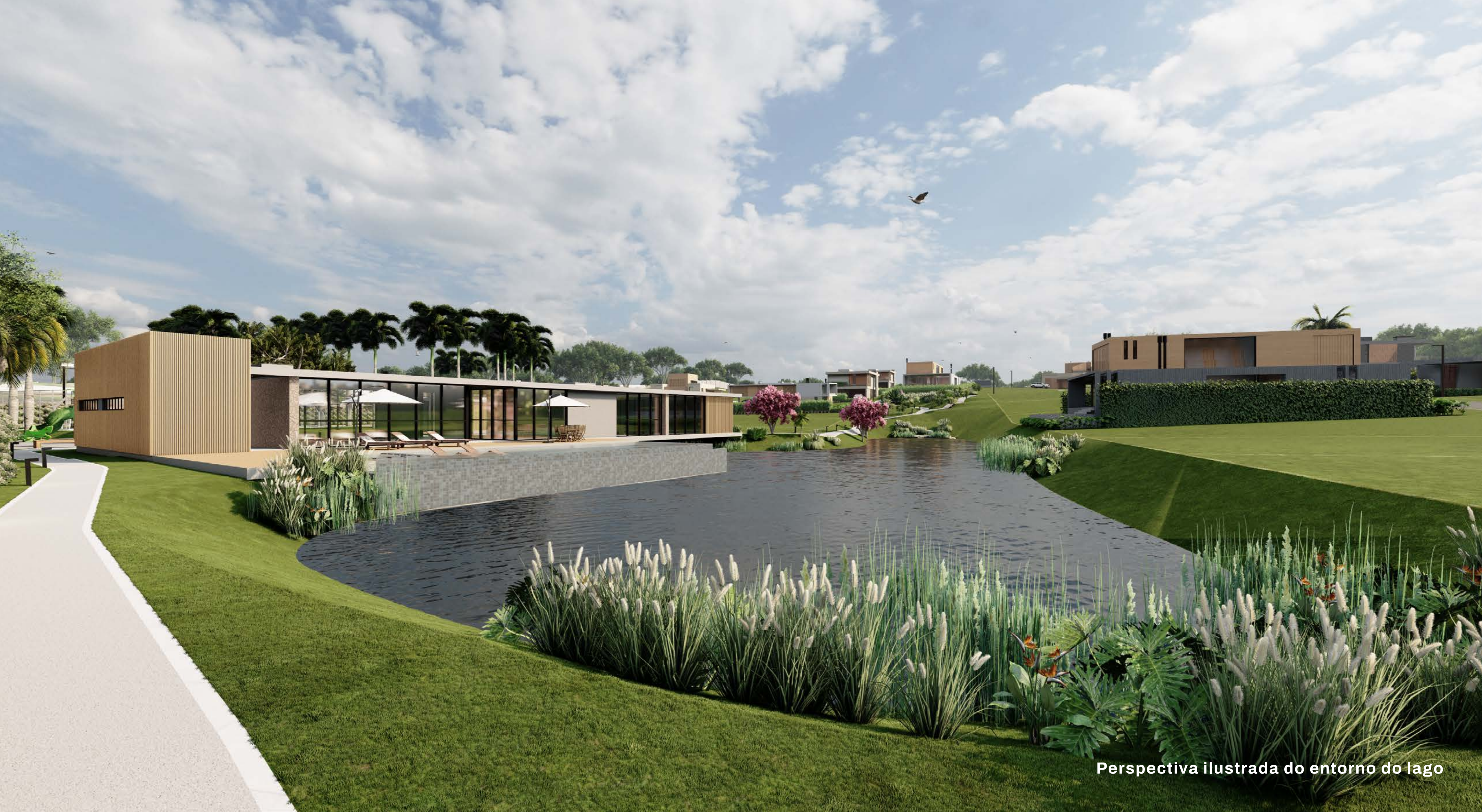
Perspectiva ilustrada do entorno do lago