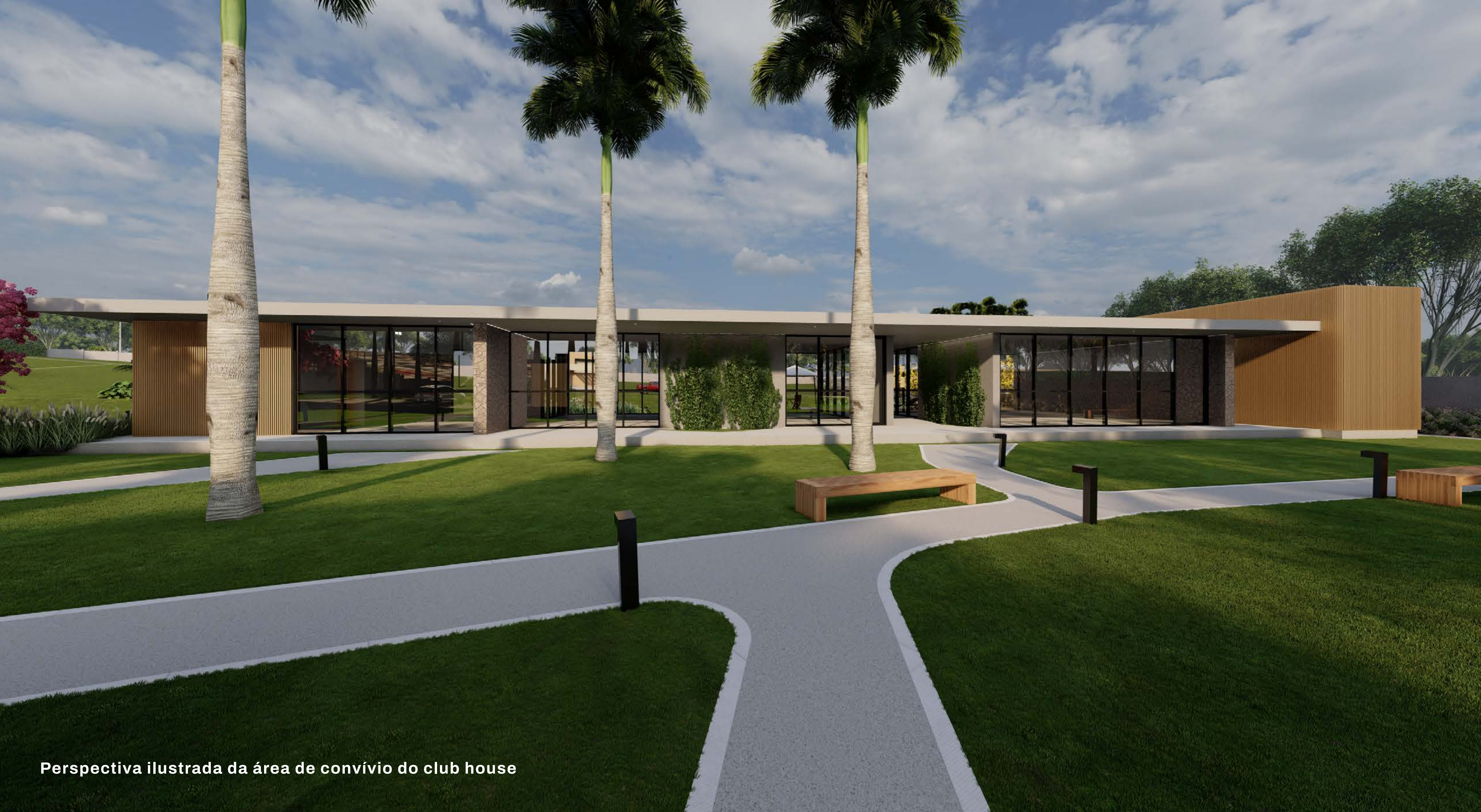
Perspectiva ilustrada da área de convívio do club house