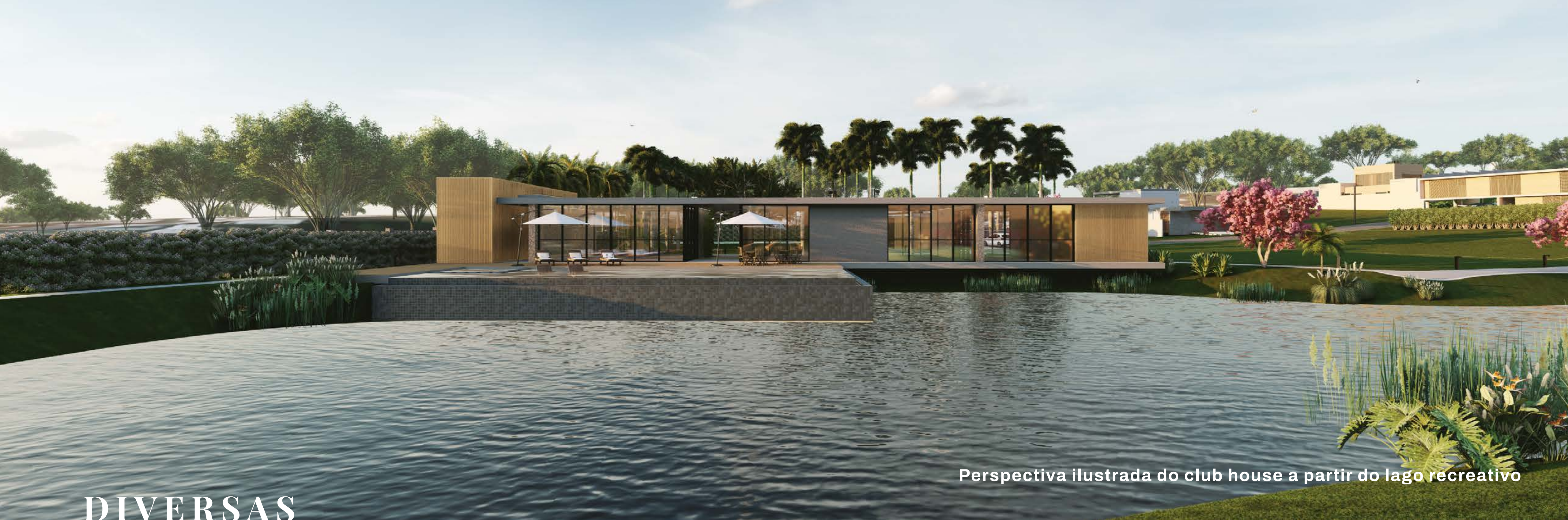
Perspectiva ilustrada do club house a partir do lago recreativo