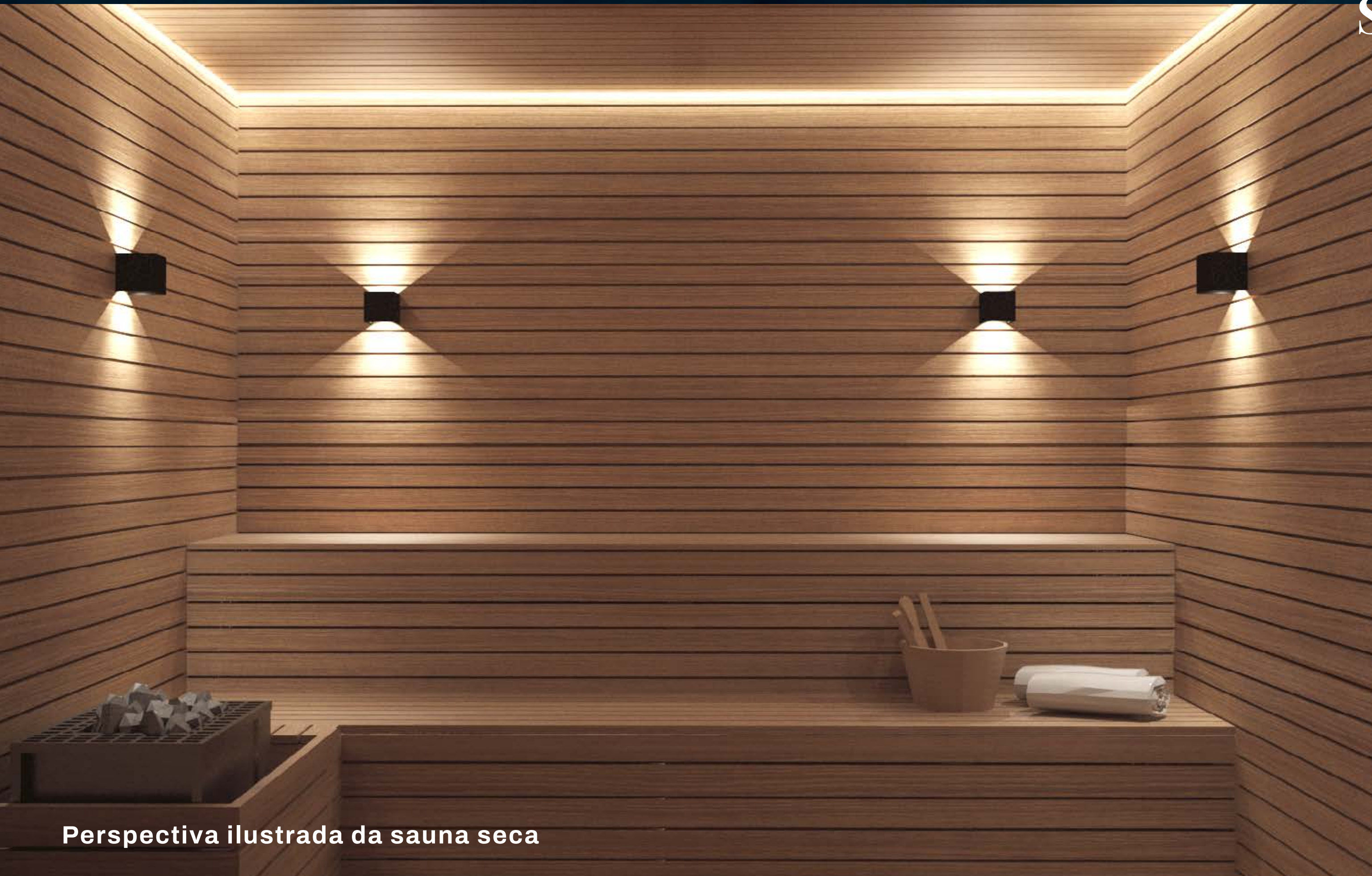
Perspectiva ilustrada da sauna seca

Após os exercícios, tenha à disposição um verdadeiro spa, com sala de massagem e sauna seca, que alivia a tensão e o estresse, auxiliando na limpeza e rejuvenescimento da pele.