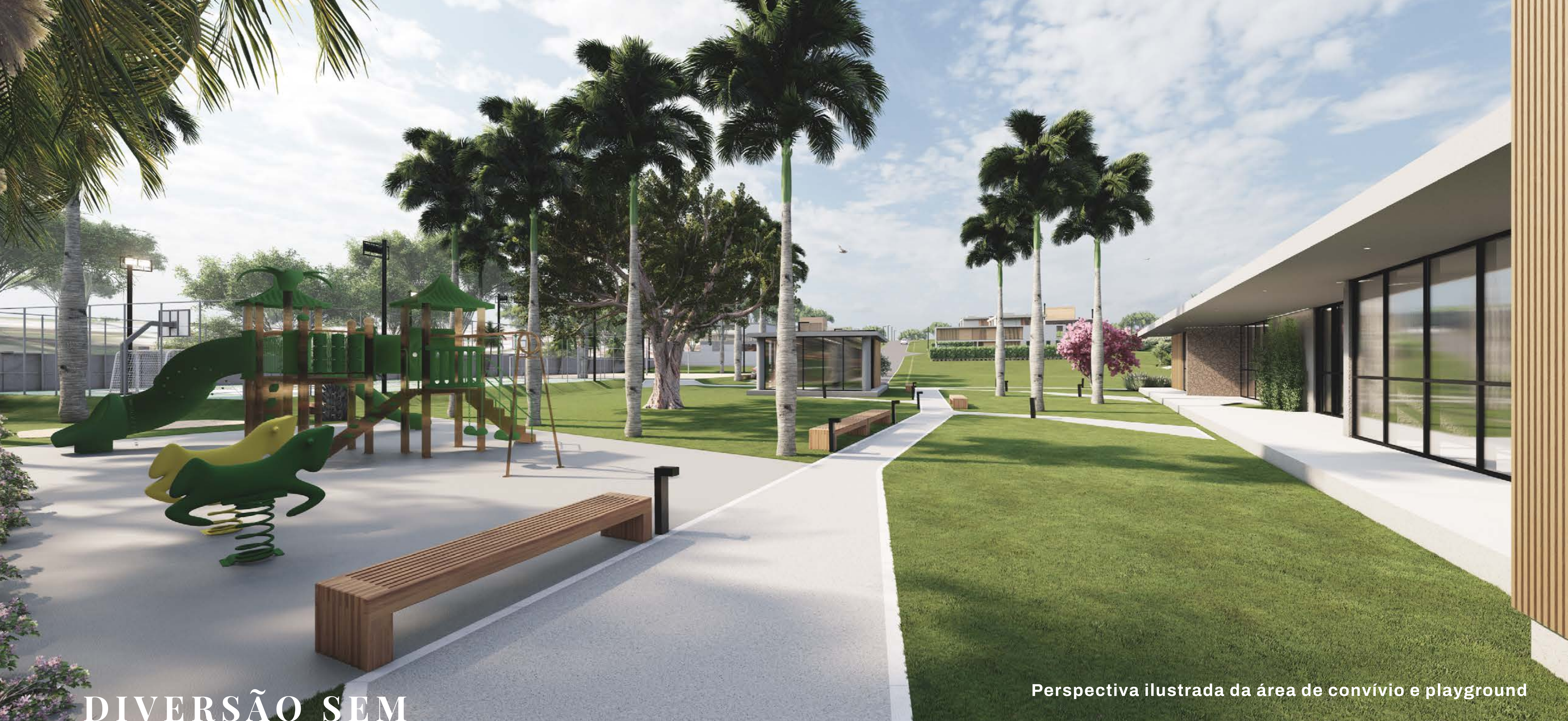
Perspectiva ilustrada da área de convívio e playground