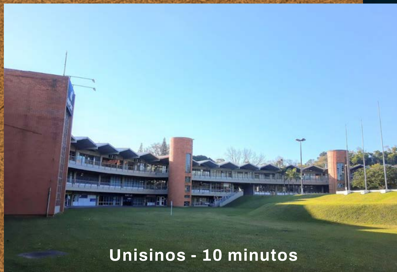
Unisinos - 10 minutos